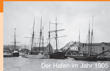
Der Hafen im Jahr 1905

wird auf eine Größe von 93m Länge, 25m Breite und 2,50m Tiefe ausgebaggert. Erneute Vergrößerung des Hafens von 1865 bis 1871 auf