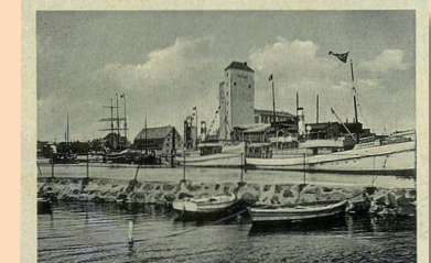
Hafensicht aus dem Jahr 1920